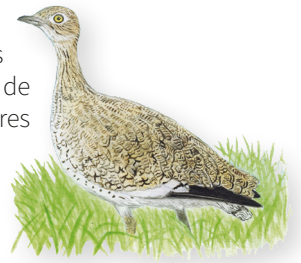
Ouarde canepetière femelle