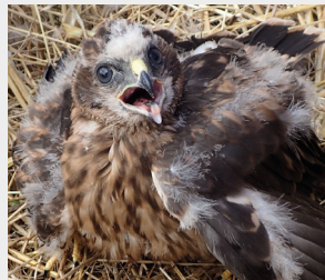
Réponse : Je suis un jeune busard Saint-Martin au nid.

Je suis un jeune oiseau, plus tout à fait oisillon mais pas encore en âge de voler. Mes parents sont des rapaces faisant leur nid au sol dans la plaine. Ils ont une préférence pour les champs de blé ou d'orge.